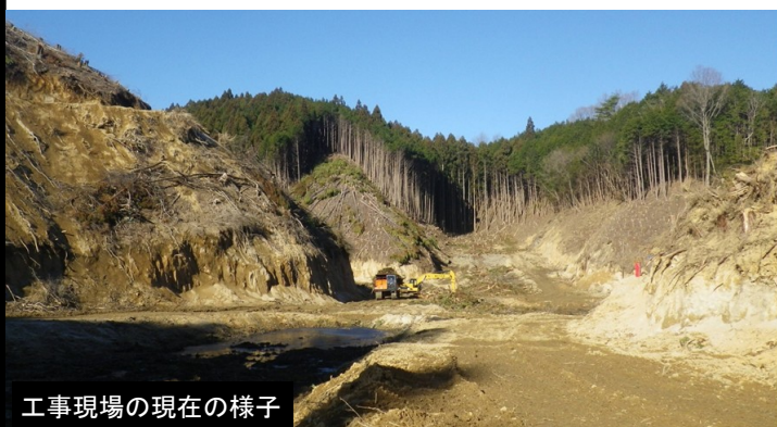
工事現場の現在の様子

建設する新最終処分場は、埋立容量約18万立方メートルのクローズドシステム処分場です。埋立容量約9万立方メートルの鉄筋コンクリート製の埋立槽2槽の全体を屋根で覆い、雨水などを遮断し、害虫・害獣やごみの飛散を防ぎます。また、埋立槽の内面に遮水シート（底面は二重）を貼り、水密性を高めます。更に、より安全性を向上させるために漏水検知システムを設置し、周辺環境への影響や水源に対するリスクを抑えます。