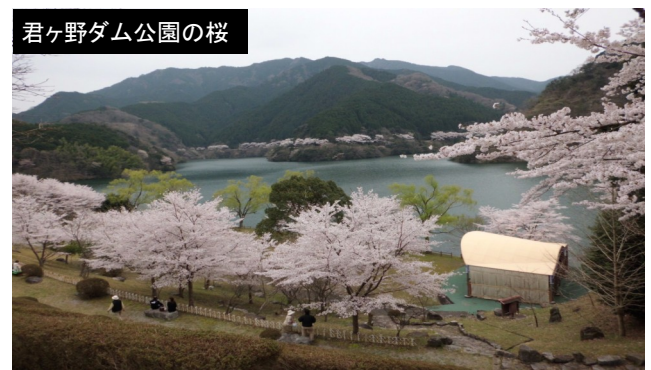
君ヶ野ダム公園の桜