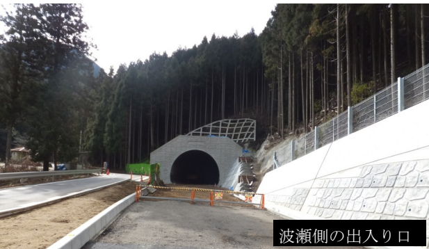
波瀬側の出入り口

予想よりも土質が良く、湧き水も思ったより少なかったため、当初22箇月間予定されていた掘削工事が15箇月で終了し、これに引き続き覆工工事も当初の予定どおり終了しました。現在は、舗装工事前の路面排水路敷設工事が進められており、舗装工事も今年の秋には完了する予定です。