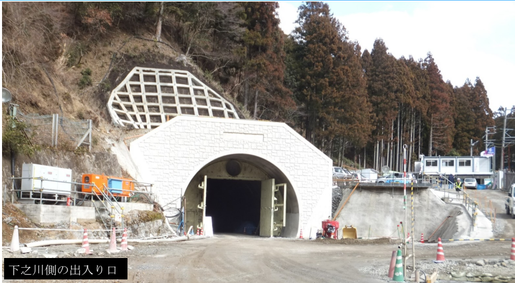
下之川側の出入り口

昨年6月に貫通式典が行われた全長1,637mに及ぶ矢頭トンネルは、トンネルの天井部分などの表面をコンクリートで固める覆工工事が終了し、いよいよトンネル内の舗装工事が始まります。