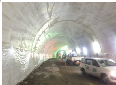
覆工工事を終えたトンネル内の様子

今回の工事現場の取材に当たっては、三重県津建設事務所と鹿島・日本土建・勢和JV工事事務所の方々に大変お世話になりました。