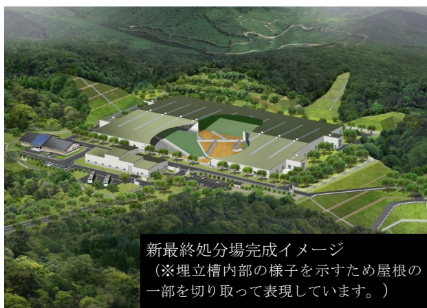
新最終処分場完成イメージ （※埋立槽内部の様子を示すため屋根の一部を切り取って表現しています。）