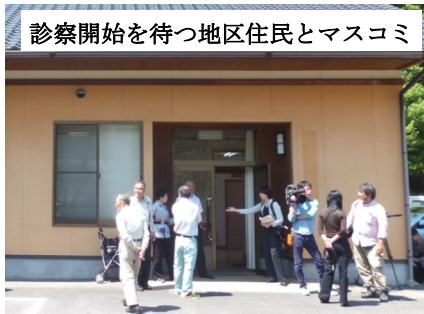
診察開始を待つ地区住民とマスコミ

伊勢地地区住民の皆さんはもとより、他地区の皆さんも積極的に受診していただき、長く存続するだけでなく、美杉の地域医療が更に充実