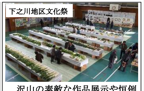
下之川地区文化祭

沢山の素敵な作品展示や恒例の農産物の即売会も行われ、バザーや歌、演奏等もあり、大勢の方で賑わいました。