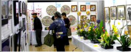
やわた秋まつり 今年も盛大に開催されました