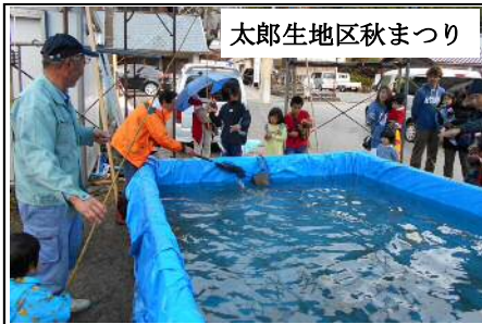
太郎生地区秋まつり