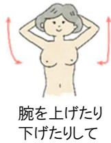
腕を上げたり 下げたりして