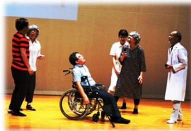
昨年度の寸劇の様子

住み慣れた美杉町で元気に年をと り、暮らし続けるために、今からで きることを「顔の見える会」のメン バーが演じる寸劇で、楽しみながら いっしょに考えましょう。