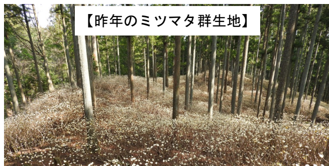
【昨年のミツマタ群生地】