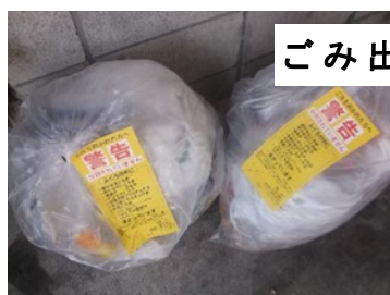
ごみ出しの悪い例