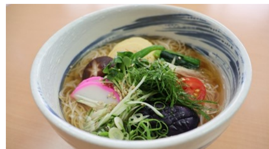
冷やしそうめん 700円