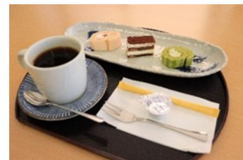
コーヒーセット 400円