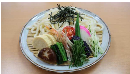
ざるうどん 700円(税込)