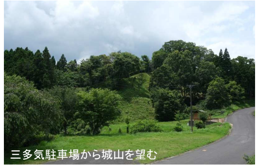
三多気駐車場から城山を望む

城山の裾にある平坦地に立つと、この辺りに北畠氏の家臣の屋敷があったのかな?などと想像がふくらみます。