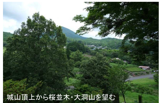
城山頂上から桜並木・大洞山を望む