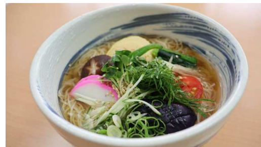
冷やしそうめん 700円(税込)