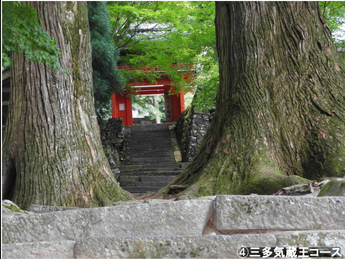
④三多気蔵王コース