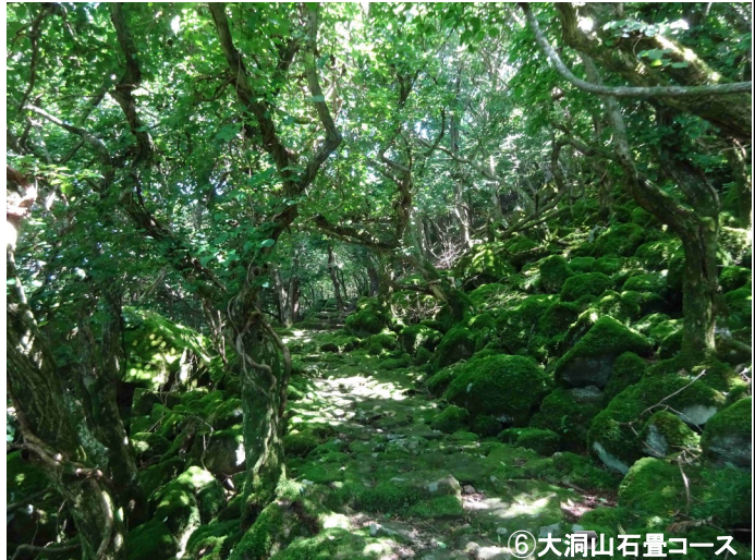
⑥大洞山石畳コース

津市森林セラピー基地「健康の郷・美杉～都市近郊の癒し空間～」は、美杉町の自然を活かした12のコースがあります。身近にある森林セラピー基地を利用することで、免疫力の向上、NK細胞の活性化、ストレスの緩和など健康への有効な効果が期待されます。健康増進のためにも利用してみませんか？