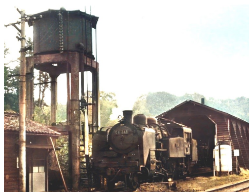
モノクロ写真をAIソフトによりカラー加工したもの