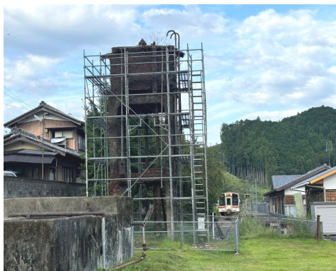
現況調査中の給水塔