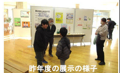
昨年度の展示の様子

ご近所の方とお誘いあわせのうえ、ぜひお越しください。 詳しくは、配布されるチラシをご覧ください。