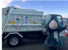
展示・体験コーナー

内容：環境をテーマとした展示・体験コーナー、緑と花のコーナー、地元物産を扱う地産地消・飲食コーナー、舞台コーナーの催し、小中学生の環境学習、環境ポスター展示、フリーマーケットなど