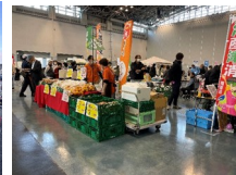
地産地消・飲食コーナー