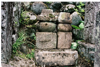
西向院の一石五輪塔(二基)

これは、「十干十二支」という年をあらわす「みずのと ひつじ」の年を指します。塔の形(十七世紀中頃)と併せて考えると、この塔が寛永二十年(一六四三)年に作られたものだということがわかります。(津市石造物調査会)