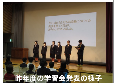
昨年度の学習会発表の様子