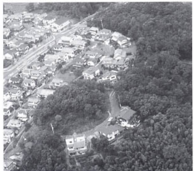
池の谷古墳(南東から前方部は宅地化される)

ところで、津市の地名は、博多津(福岡県)や坊津(鹿児島県)と並んで日本三津と称された港湾都市「安濃津」に由来することは広く知られるところです。しかし、安濃津は明応7年(1498)の大地震で壊滅的な打撃を受け衰退したと言われています。長く港や港町の実