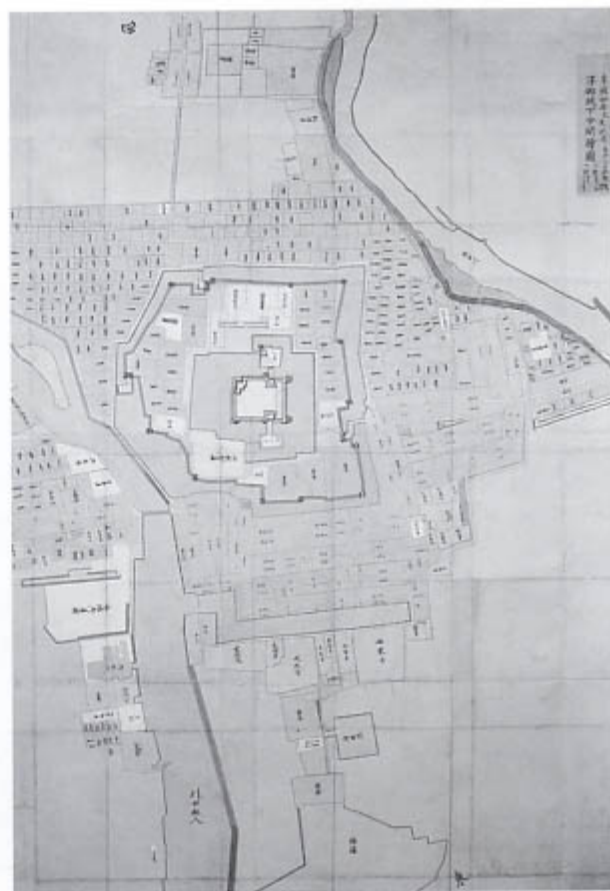
津御城下分間絵図(部分)[享保4年(1719)](個人蔵)