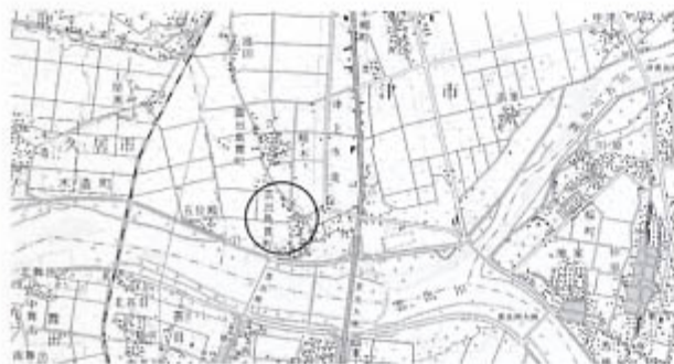
遺跡位置図（1:50,000）[国土地理院『松阪巻』1:25,000より]