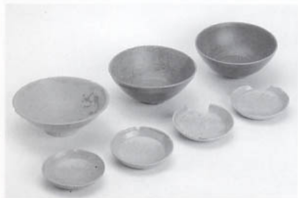
出土した青磁（後列右2点）と白磁