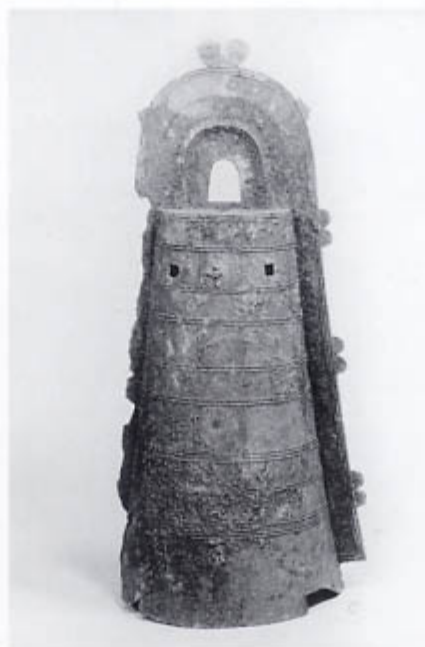
2号鐸[86.3cm](東京国立博物館蔵)