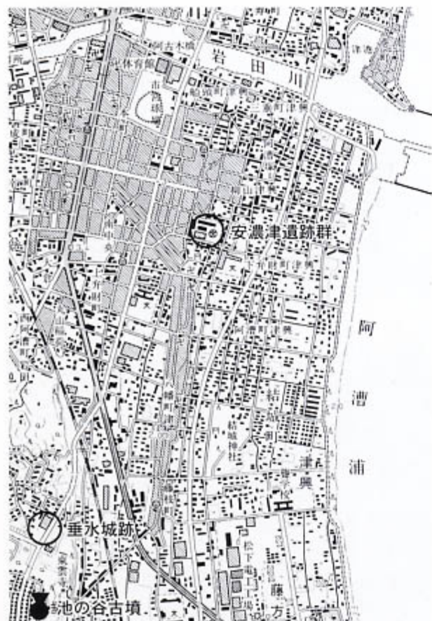
遺跡位置図 (国土地理院「津東部」1:25,000)

13世紀の溝からは山茶碗が大量に出土していますが、これらについては未使用のものが圧倒的多数を占めます。このことは、山茶碗が生産地で選別され、完成品として出荷され