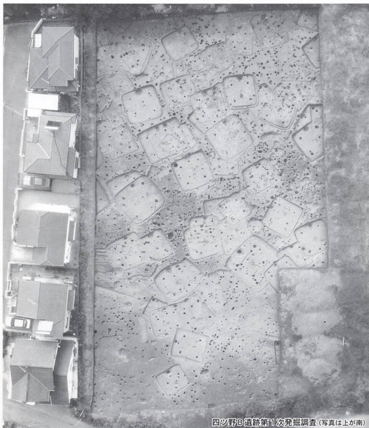
四ツ野B遺跡第1次発掘調査(写真は上が南)