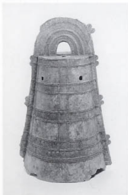
高茶屋銅鐸 1号鐸 [残存高66.3cm]