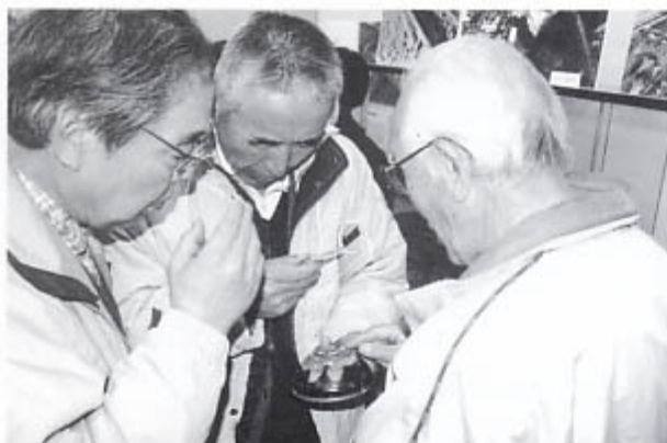
本物をじっくり観察

4日目は、研究の基礎作業と研究成果の講義です。土器の実測体験では「難しいなあ」と言いつつも、表情は真剣そのもの。気分はすっかり考古学者だったようです。最後は、発掘調査に基づく研究成果の講義です。古代から中世にかけて津の風景が大きく変わり、私たちが知る「ふるさとの風景」ができあがる過程を解説しました。また「発掘が語る災害情報」と題して発掘でわかる地震情報を紹介し、埋蔵文化財調査が災害予防にも貢献できることを紹介しました。講義終了後、全日程参加者には教育長から修了証が授与され、アンケート調査の感想文には「歴史を知る楽しさがわかった」「もっと深く知りたい」といった声が寄せられました。（山口 格）