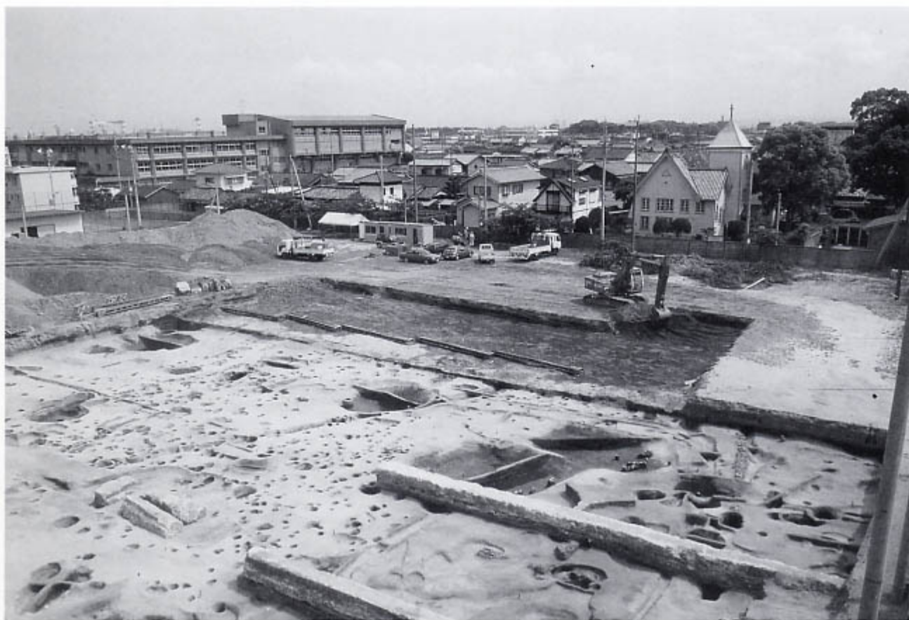
調査区全景 (左後方の校舎は育生小学校)※