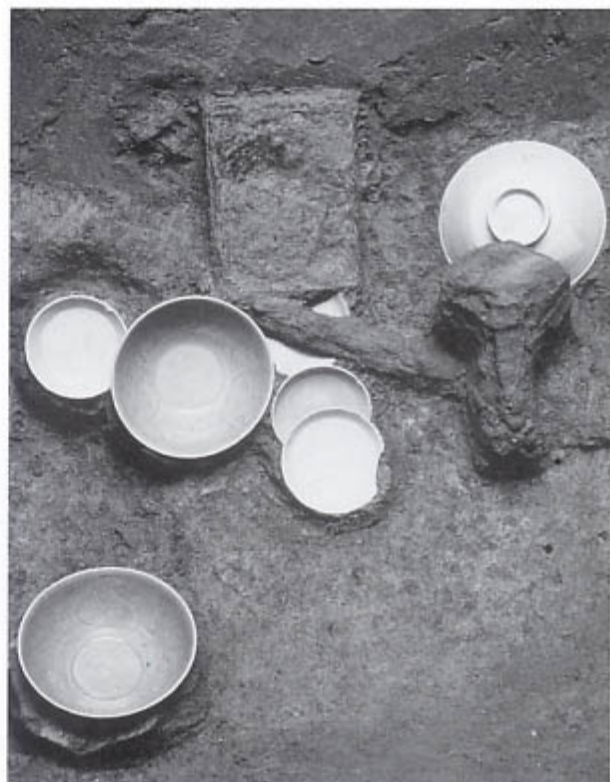
副葬品の出土状況※