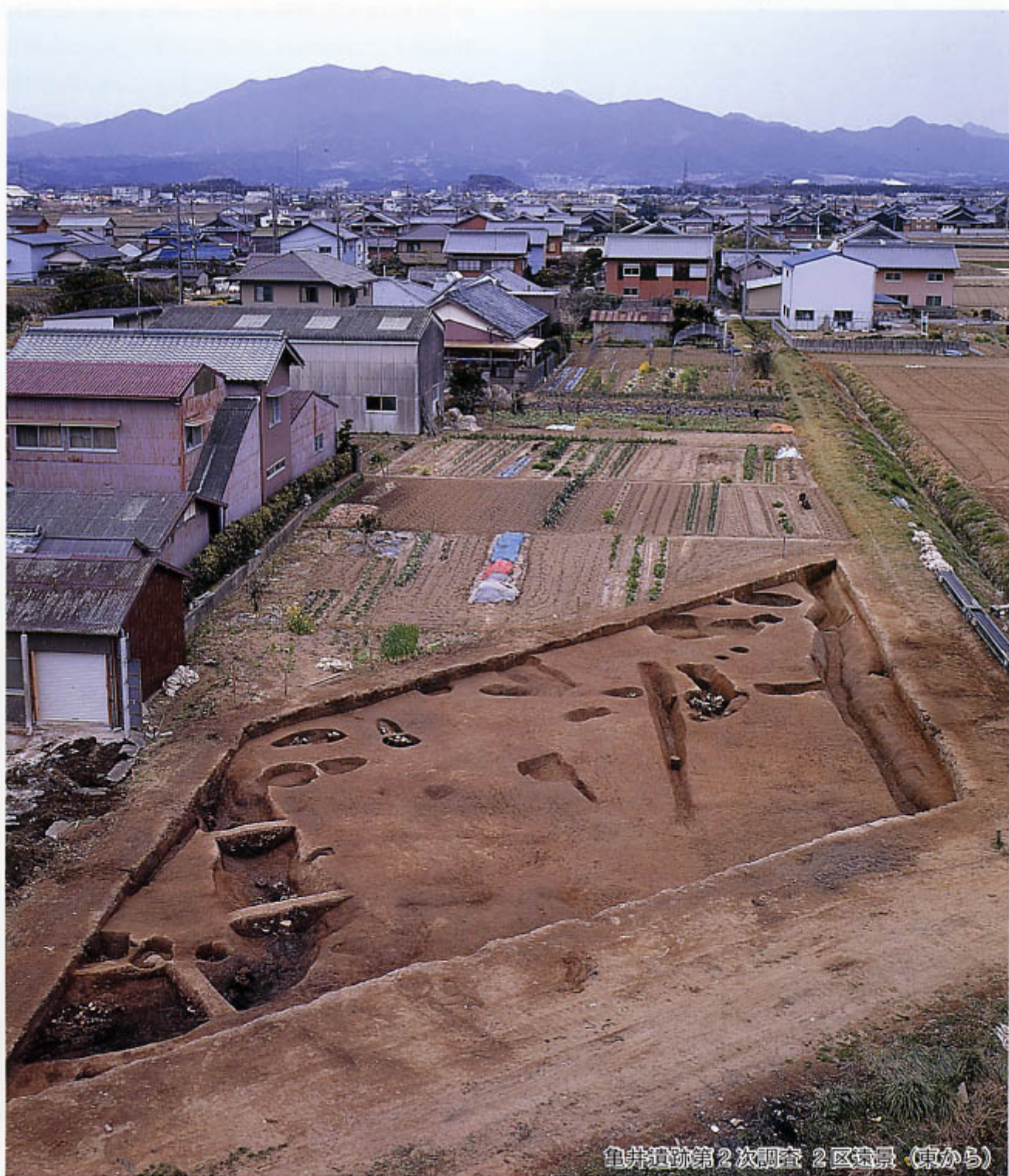
亀井遺跡第2次調査 2区発掘景（東から）