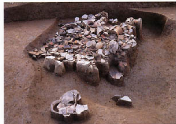
第2次調査(2区) 弥生時代中期後半の土坑 (東から)