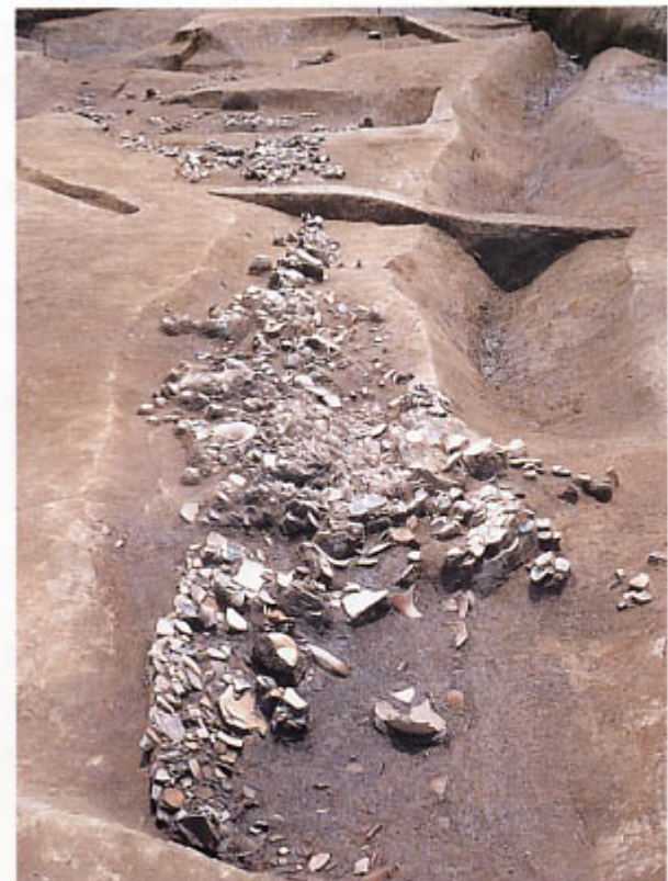
第3次調査 L字状の溝の続き (北から)