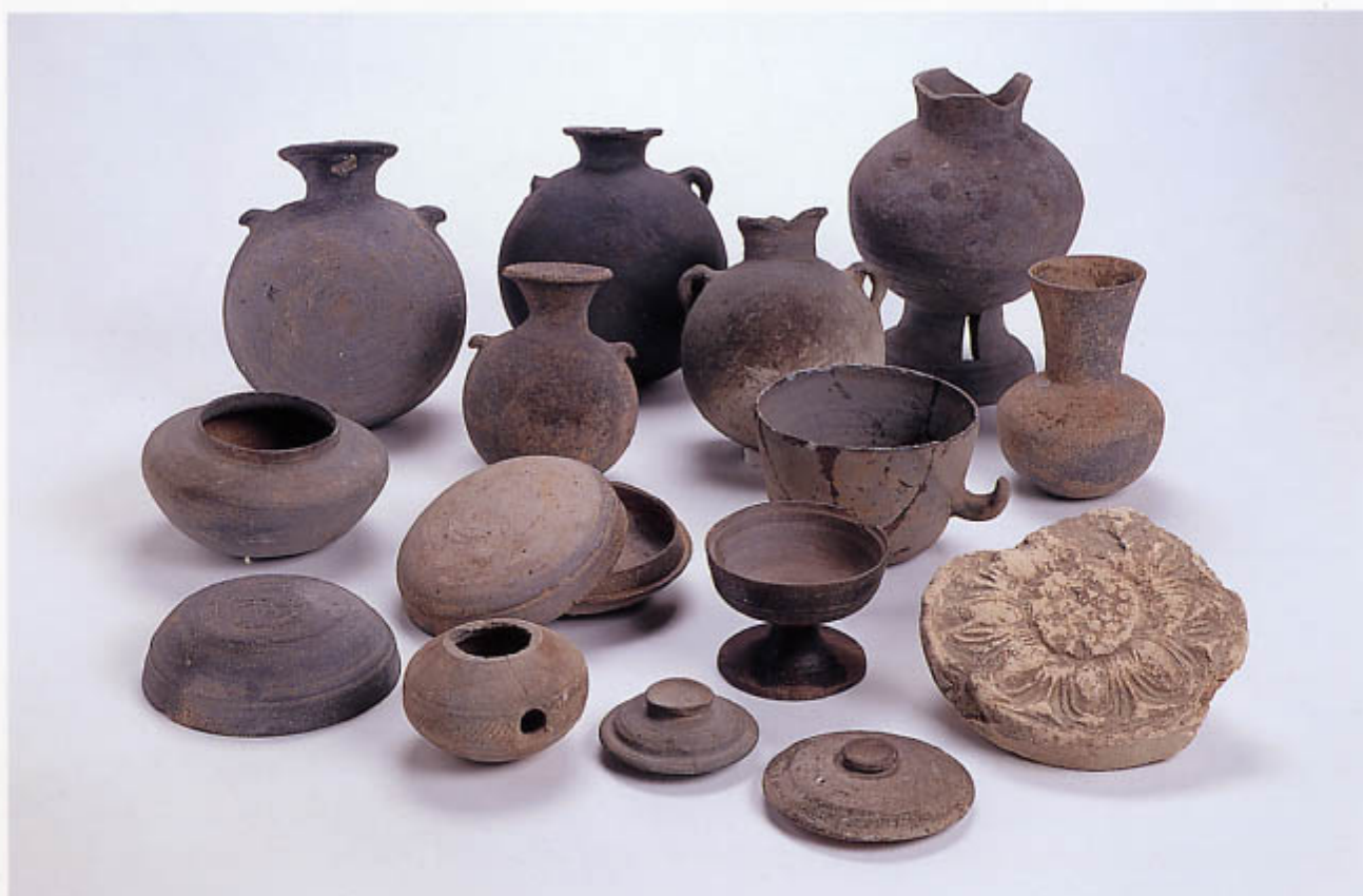
一志町小山町地内出土遺物