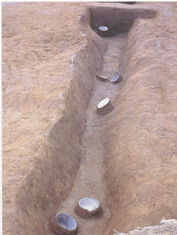
第2次調査(2区) 13世紀前半の溝 (東から)