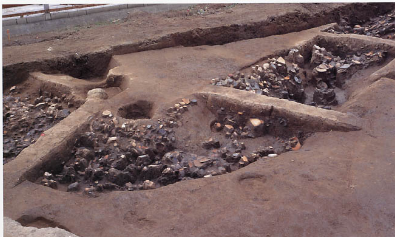
第2次調査(2区) L字状に曲がった弥生時代中期後半の溝(北東から)