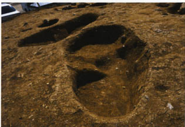
見つかった土坑(東から)