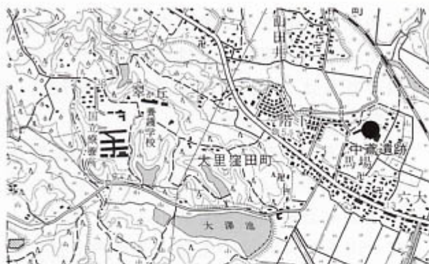
遺跡位置図（国土地理院『棕本』1:25,000より）