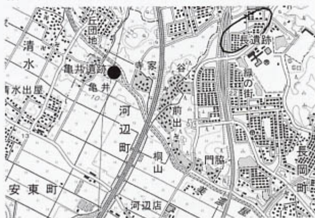
遺跡位置図(国土地理院『津西部』1:25,000より)

第3次調査 平成19年6月～8月に、2区の南側530㎡の発掘調査を行ったところ、2区で検出されたL字状に曲がった弥生時代中期後半の溝の続きが見つかったほか、微高地の南裾を西から東へと流れる弥生時代の自然流水