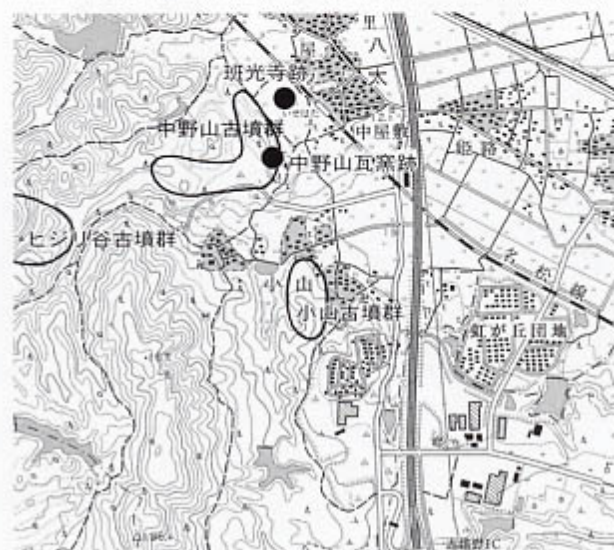
遺跡位置図(1:30,000 国土地理院『大仰』1:25,000より)

雲出川右岸(旧一志郡内)には、古代寺院が多く建立されており、小山地区に隣接する八太地区には、班光寺跡(八太廃寺)や中野山瓦窯跡があり、これらの遺跡からも単弁八葉蓮華文の軒丸瓦が出土しています。(藤田充子)