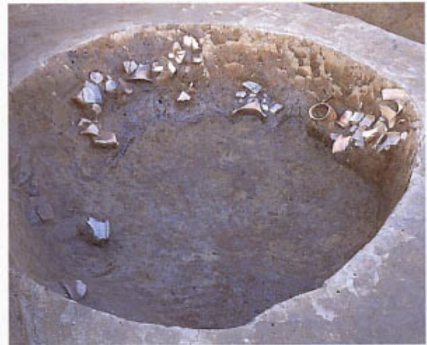
第2次調査(2区) 弥生時代中期中葉の土坑 (南から)

亀井遺跡から500mほど東の丘陵には、200棟近い住居跡が見つかった なが 長遺跡、また、安濃川左岸の水田地帯には、県下有数の拠点集落である のうそ 納所遺跡など、数多くの弥生時代の遺跡が分布しています。今後、調査成果の整理・研究が進むにつれ、今回見つかった遺構の性格や周辺遺跡との関係なども、次第に明らかになってくることでしょう。(藤田充子)