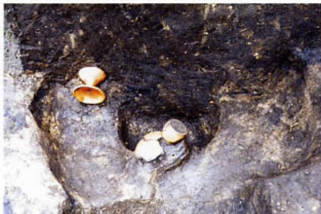
土師器が見つかった土坑(南から)