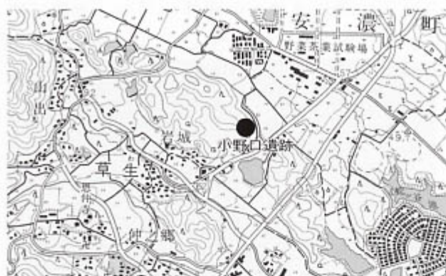
遺跡位置図(国土地理院『棕本』1:25,000より)