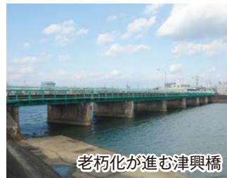
老朽化が進む津興橋

市民生活のご不便を解消し、安心してご利用いただけるよう、道路、堤防、下水道など社会基盤の整備を進めます。津駅北の大谷踏切の拡幅事業に着手したのに続き、通称近鉄道路の津興橋の架け替えを決定しました。