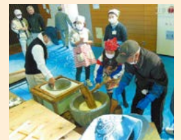
地域の人材を講師に招いて授業を行った