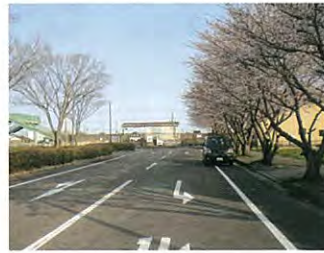
伊勢鉄道河芸駅周辺