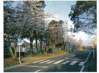
千里ヶ丘自然公園