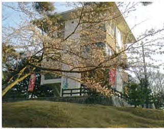
本城山青少年公園 (伊勢上野城跡)

4月4日津市の桜の開花宣言がありました。今年は3月が冷え込んだこともあり、平年（3月30日）より5日遅く、昨年（4月1日）より3日遅い開花宣言です。地域内各所で咲き誇り、美しいピンク色で多くの人を楽しませてくれました。