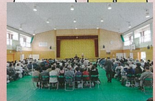
■ 千里ヶ丘地区 ■