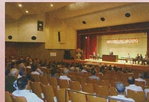
■ 黒田地区 ■