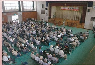
■ 上野地区 ■