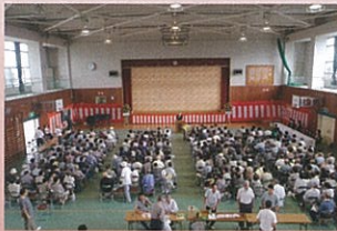
■ 豊津地区 ■