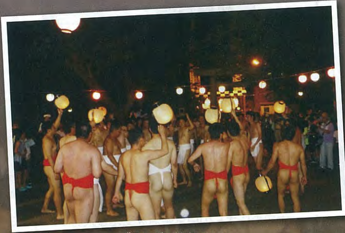
ざるやぶり神事のねり