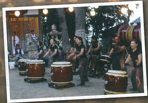
河芸太鼓衆どこんこ

7月15日（火）、約450年の歴史を持つ市指定無形民俗文化財の「ざるやぶり神事」が、今年も盛大に一色の八雲神社で、豊漁と安全を願って行われました。