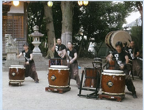
河芸太鼓衆 Do. 魂鼓（どこんこ）