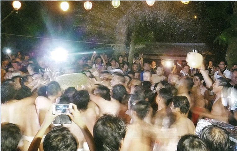
ざるやぶり神事の練り

7月15日（水）約450年の歴史を持つ津市指定無形民俗文化財の「ざるやぶり神事」が、今年も盛大に一色の八雲神社で、豊漁と安全を願って行われました。