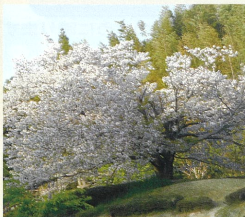
本城山青少年公園