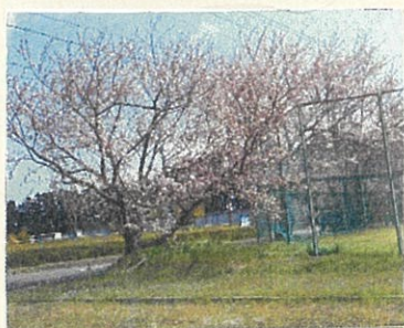
千里ヶ丘自然公園

毎年、3月末から4月初旬にかけて、河芸地域の名所で淡いピンク色のさくらの花が咲き乱れ、見る人の目を楽しませてくれます。三重県下の新型コロナウイルス感染症の拡大状況を踏まえ、お花見に訪れる方には「感染しない、させない」ための行動を心がけ、感染拡大防止にご協力いただきますようお願いいたします。