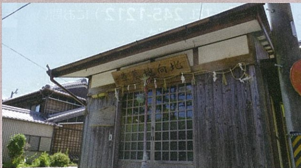
北向地蔵堂の全景