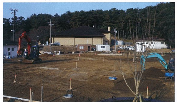
整備工事の様子(1月中旬頃)

また、芝生広場には、ベンチや遊具などが設置され、憩いの場として多くの皆さんに利用していただきたいと思います。