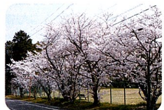
千里ヶ丘自然公園