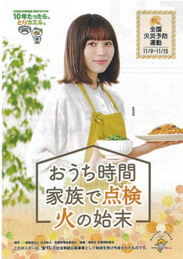
(火災予防運動ポスター)

また、今後寒い時期を迎えるにあたり、各家庭において一人ひとりの意識を十分持って火災を防ぎましょう。