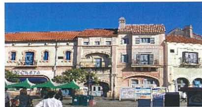
和歌山 ポルトヨーロッパ