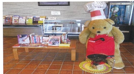
ぼんすけコーナー