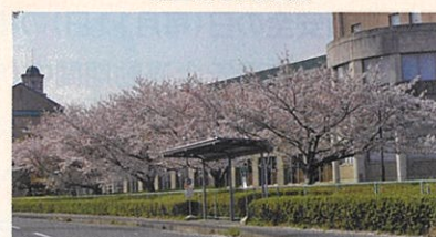
鈴鹿大学前 ※昨年4月初旬の様子