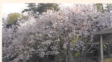
本城山青少年公園