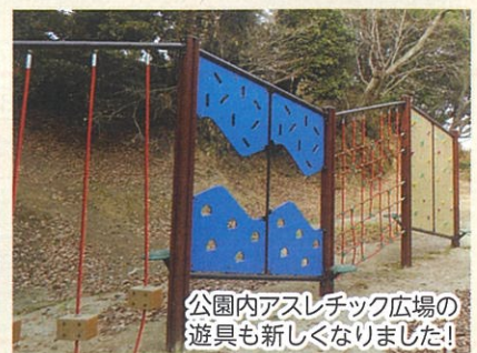
公園内アスレチック広場の遊具も新しくなりました!