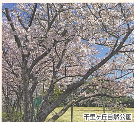
千里ヶ丘自然公園