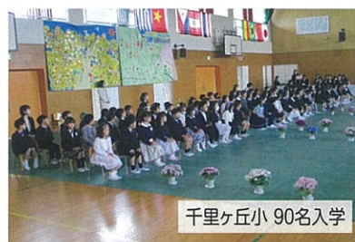
千里ヶ丘小 90名入学