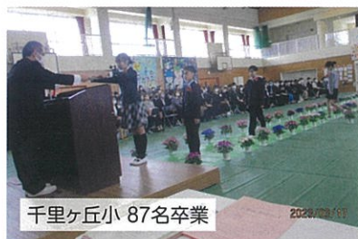
千里ヶ丘小 87名卒業

卒業式は、中学校で3月13日、各小学校で3月17日に行われました。卒業生はそれぞれの思い出と希望を胸に、学び舎を巣立って行きました。