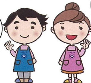
津市食生活改善推進協議会キャラクター 食くん・改ちゃん