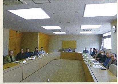
河芸地区地域審議会の様子