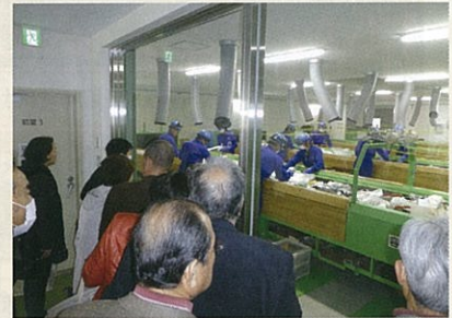
現地視察（津市リサイクルセンター）