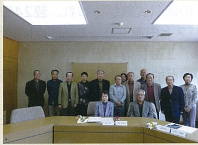
河芸地区地域審議会のメンバー