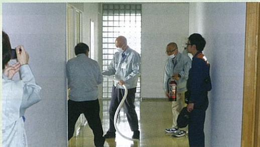
火元の初期消火訓練

3月7日（月）、河芸総合支所・河芸教育事務所・北消防署河芸分署の職員全員で消防訓練を行いました。訓練では、実際に火災報知器を鳴らし、負傷者の搬送や屋内消火栓を使った放水訓練などに真剣に取り組みました。