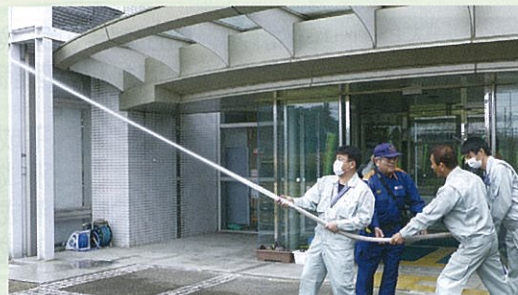
職員による放水訓練