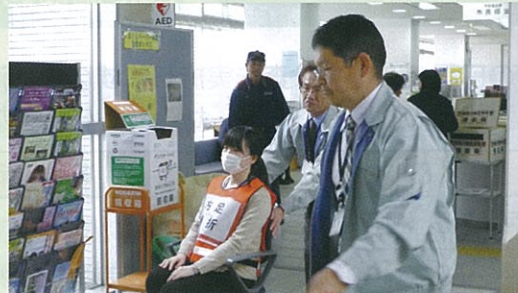
負傷者の搬送訓練