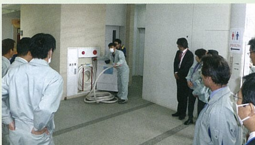
屋内消火栓の説明