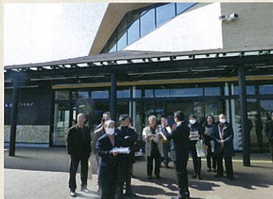
現地視察（道の駅 津かわげ）