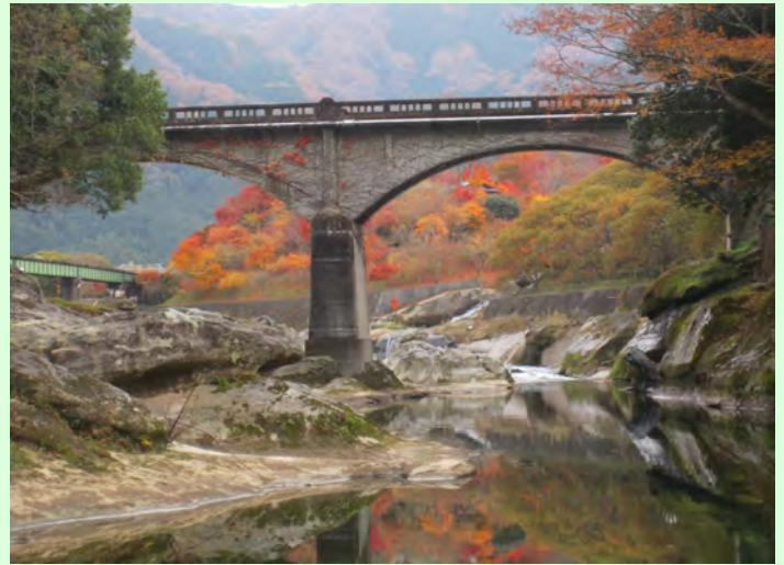
家城ライン二雲橋から 11月30日