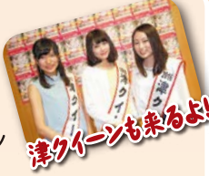
津クイーンも来るよ!