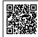
違反対象物公表制度