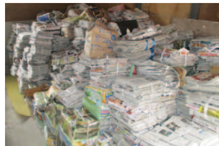
ごみ一時集積所に出された資源物

資源物の持ち去り行為は、決められた収集日の前日の夜間に多く発生しているため、前日から出さずに、当日の朝に出すようご協力をお願いします。朝出しができない人は、市内にある6カ所のエコ・ステーションをご利用ください。また、地域によっては、リサイクル資源の回収活動(廃品回収)を行っていますので、ご利用ください。