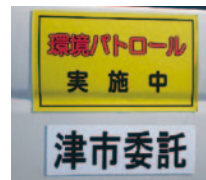
パトロール車の表示

なお、持ち去り行為を発見した場合は、直接声を掛けるのは避け、発見した場所、時間、車両のナンバーなどを環境政策課(☎229-3258)または各総合支所地域振興課へご連絡ください。