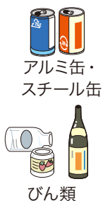
アルミ缶・ スチール缶