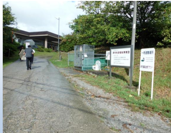
津市たるみ児童福祉会館グラウンド入口

目標とする避難先を目指します。避難経路にある 役立つもの や 危険なもの を確認しながら歩きます。