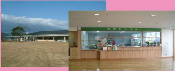
津市芸濃保健センター