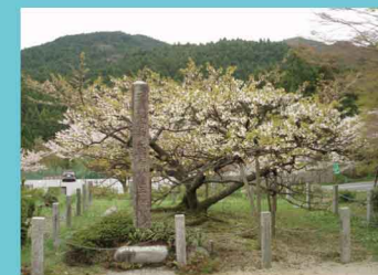
県指定天然記念物 ・・・長徳寺の龍王榎