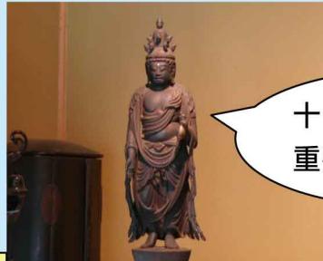
十一面観音立像 重要文化財に指定

地区の集会所に重要文化財が安置されている。毎年1月17日、8月17日をご開帳の日となっている。