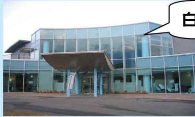
白山保健センター

センターを出発して田んぼ道を進むと、季節の色を感じさせる山々や広がる田畑、遠く青山高原の風車など、のどかな風景が楽しめます。また、一日数本走る名松線に出会う事も・・・。