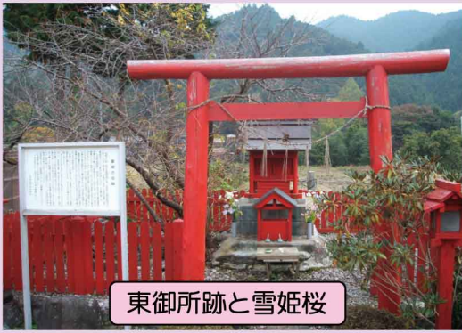
東御所跡と雪姫桜