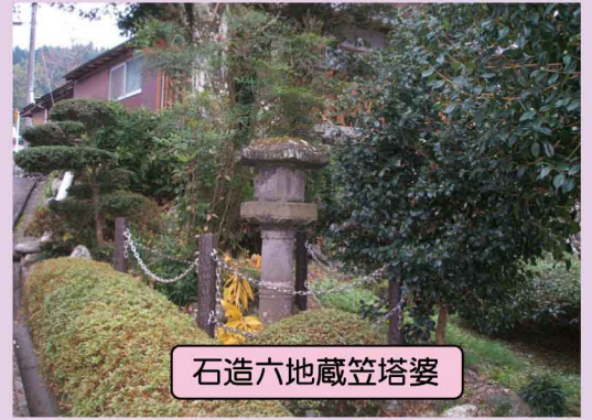
石造六地藏笠塔婆