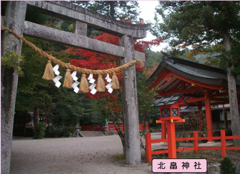
北 島 神 社