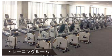
トレーニングルーム

申し込み 9月18日(月・祝)から直接窓口、または電話で津市スポーツ・メッセネットワーク(☎223-4655)へ