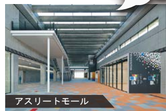
アスリートモール

オープン前に施設見学を希望する人は、ご都合の良い時間に直接サオリーナへお越しください。