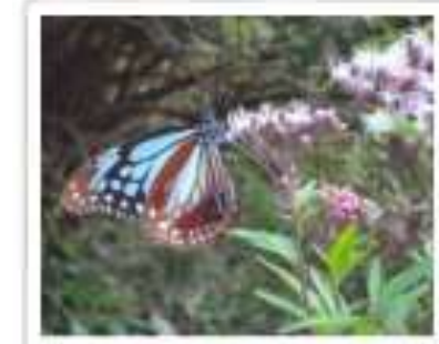
フジバカマにとまるアサギマダラ