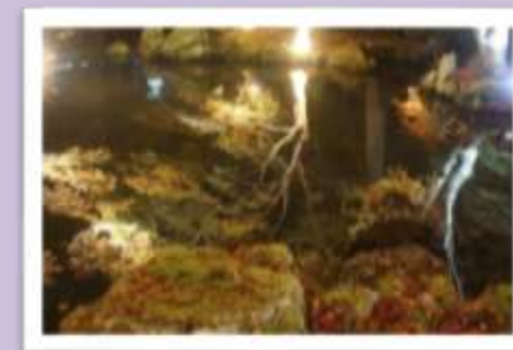
ライトアップの様子