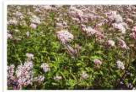
太郎生道里夢のフジバカマ畑