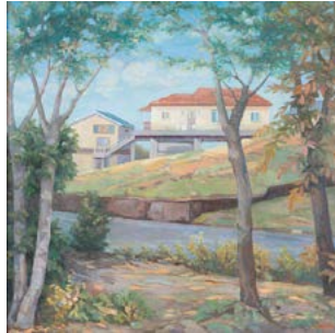
「木立ちとあかい屋根」 駒井 直子