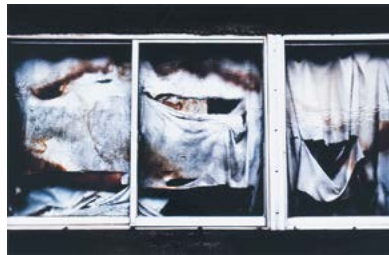
「残されしもの」 平松 宏之