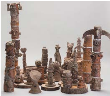
「ようこそ!トーテムポールビレッジへ」 藤田 史男