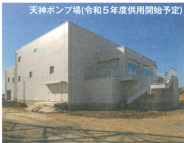
天神ポンプ場(令和5年度供用開始予定)