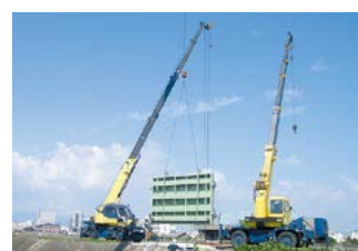
長寿命化対策事業(津市中央浄化センター放流ゲートの取り換え工事)