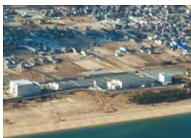
建設中の志登茂川浄化センター

平成30年度からの志登茂川浄化センターの供用開始に向け、対象地域の供用開始に向けた準備を進めます。