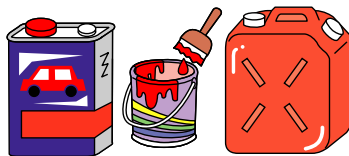
オイル・塗料・灯油