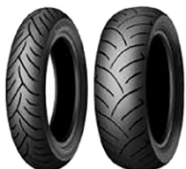
自動車・オートバイのタイヤ