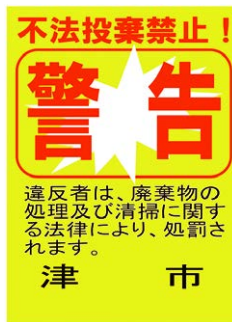
不法投棄防止看板

津市では不法投棄を防止するため、不法投棄防止看板の自治会への配布や不法投棄防止環境パトロールを実施しています。