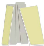
石こうボード・断熱材