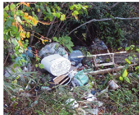
不法投棄された廃棄物

巡回や空き地などで回収し、無許可で廃棄物を収集運搬する事例も発生しています。自分たちが使っていたものが不法投棄されることを防ぐため、廃棄物を業者へ引き渡す際は、収集運搬許可業者かどうかを確認してから引き渡すようにしましょう。