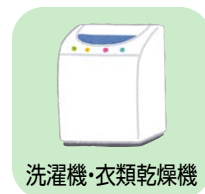
洗濯機・衣類乾燥機