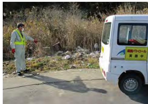
不法投棄防止環境パトロールの様子

きれいな津市を残していくために、皆さんからの情報提供が不可欠です。通報にご協力ください。