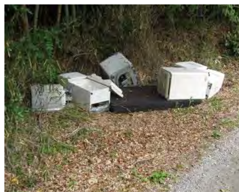
不法投棄された廃棄物

自分たちが使っていたものが不法投棄されることを防ぐため、廃棄物を業者へ引き渡す際は、収集運搬許可業者かどうかを確認してから引き渡すようにしましょう。