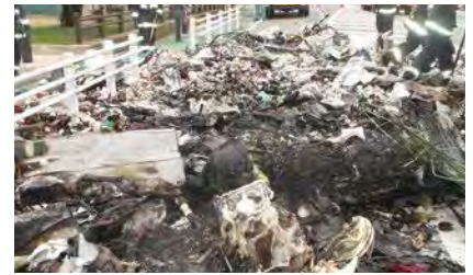
火災が発生し、収集車内のごみを出して消火した様子

充電式電池の分別を守らないと、写真のように製品から発火し、収集車や処理施設の事故になり非常に危険です。