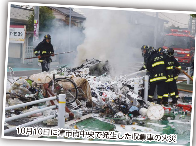
10月10日に津市南中央で発生した収集車の火災

カセットボンベやスプレー缶などが原因と思われるごみ収集車の火災事故が毎年数件発生しています。