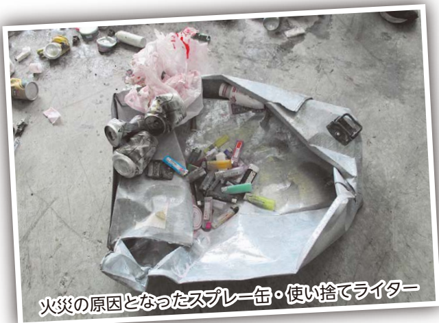
火災の原因となったスプレー缶・使い捨てライター