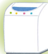
洗濯機・衣類乾燥機