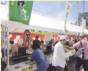
賑わった出展ブース