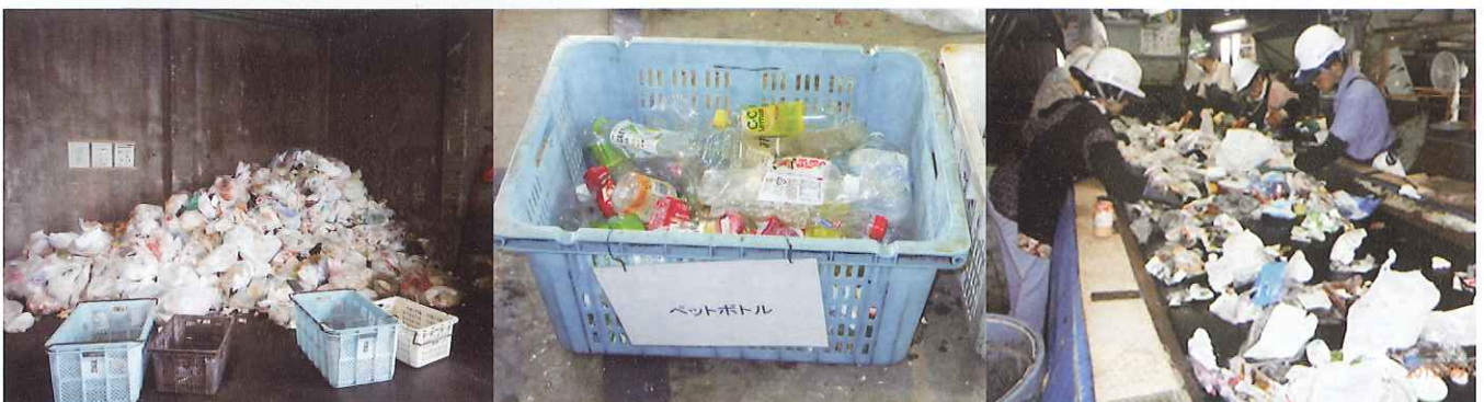
★手作業での分別作業★