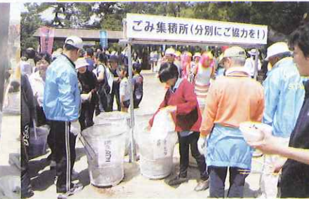
徹底されたごみの分別