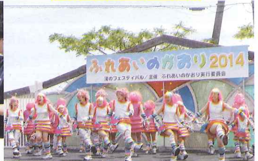
大迫力のステージショー!!