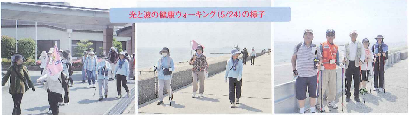
光と波の健康ウォーキング(5/24)の様子