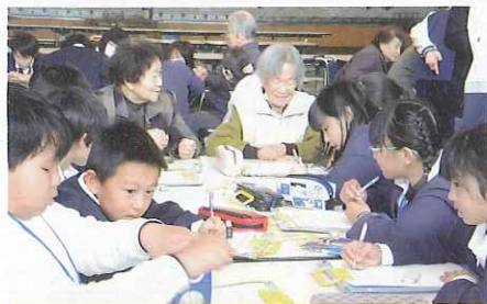
フルハウスの利用者から昔の生活と戦争 (2/23)