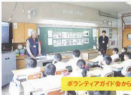
ボランティアガイド会から昔の生活と遊び (3/11)