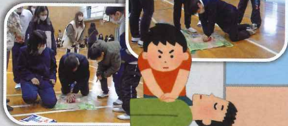
3年生 防災すごろく