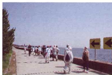
光と波の健康ウォーキング

かりん 香梨 は、『健康は笑顔から』を合言葉に、地域のみなさんが、健康に元気で過ごせるよう健康づくりの輪を地域に広げる活動を行っています。自分自身が健康になり、さらに地域の方々と楽しく交流しながら一緒に活動しませんか？